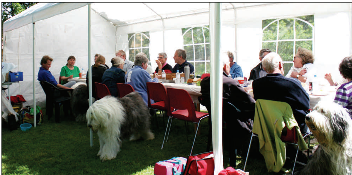
Der blev hygget og snakket hunde, mens fællesfrokosten blev indtaget i partyteltet.

mel. Et par udstillingstelte og børsteborde blev sat op og snakken gik livligt fra første færd, selvom hundene gjorde deres for at overdøve al den menneskesnak. 22 ejere og 20 hunde gav alle deres besyv med til, at Tommerup stationsby kunne høre, at her var hundetræf.