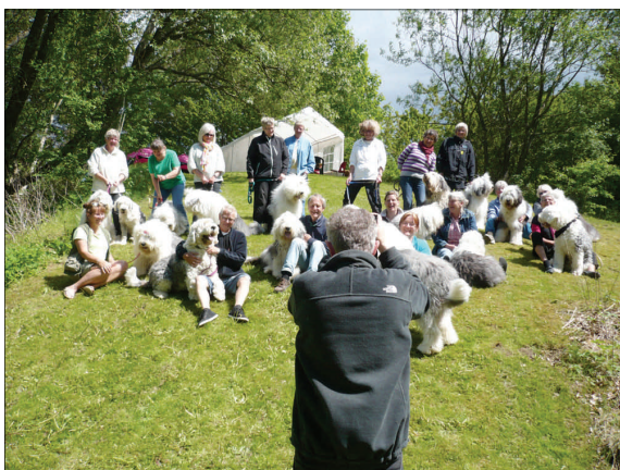
Jørgen Brieghel i gang med at tage det store gruppebillede.

Lydigheden blev anvendt til praktiske gøremål som f.eks. at gå på café og blive liggende; det var sådan set kravet for at være med og så gjorde Louis naturligvis det.