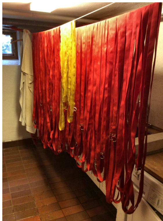
Der forestod et større tørrearbejde af telte og afmærkningsbånd efter den våde Store Lydighedsdag.

Ved 15 tiden var vi så småt ved at være færdige i de forskellige ringe og kunne begynde at pakke ringene sammen. Telte og afmærkningsbånd m.m. skulle have været videre til et lagerho-