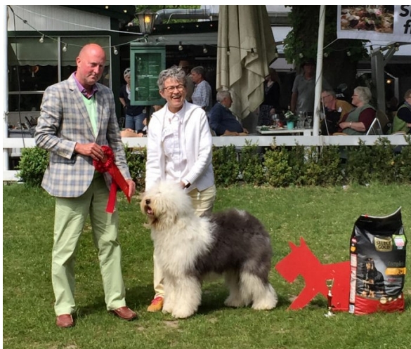
Vinder af Bakkeskue 2017: Danish Delight Yasmina.

Første sortering gik i gang og Tjecko blev stående, så var der fire hunde tilbage. Dommeren gik frem og tilbage og kiggede stort set ikke på Tjecko. Hvad betød det mon?