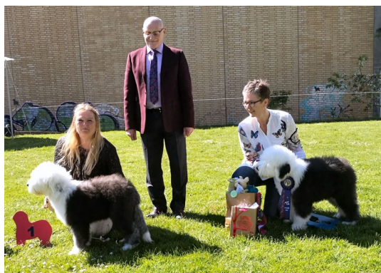
Udstillingens to babyer: Ragtales Keen On Candy og Ragtales Kind Of Special.