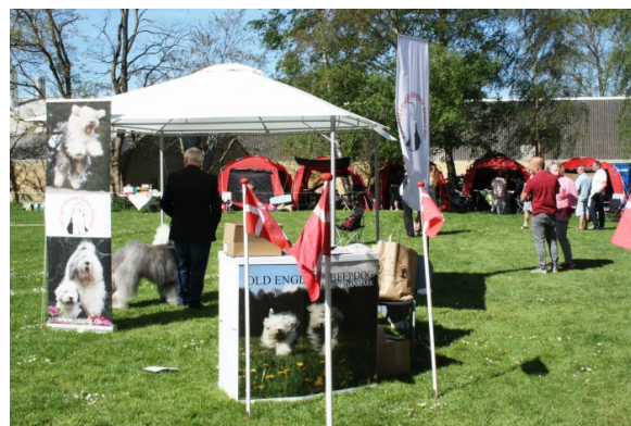
Den flotte velkompsstand.