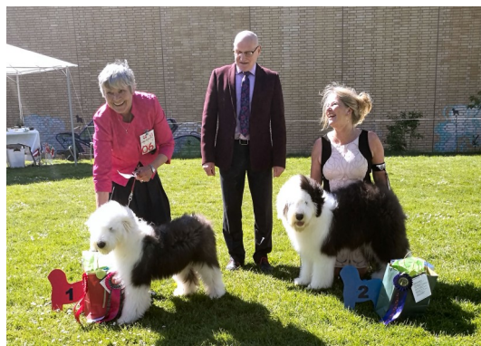
Udstillingens to bedste hvalpe: My Beautiful Butterfly Kisses og My Beautiful Bad Boy.