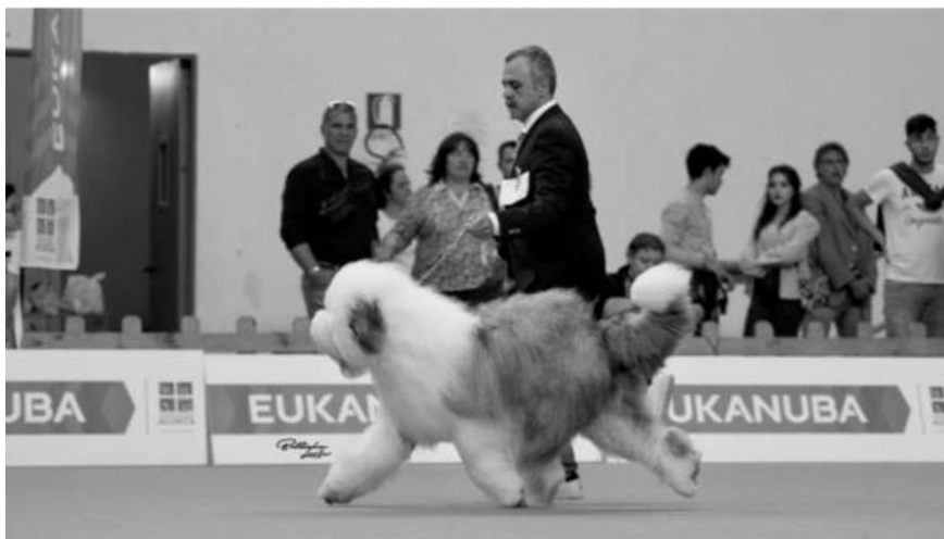
Klub CH. Hercules, Junior of Mat & Nik

Oes'en er en enestående hund, med en umiskendelig udseende, en trofast ven til hele familien. Det er en race, som p.t. går igennem nogle vanskeligheder, lige som mange andre, men som takket være nogle udholdende og seriøse opdrættere, fortsætter med at tilbyde dens uforglemmelige og uerstattelige selskab til vores hjem!