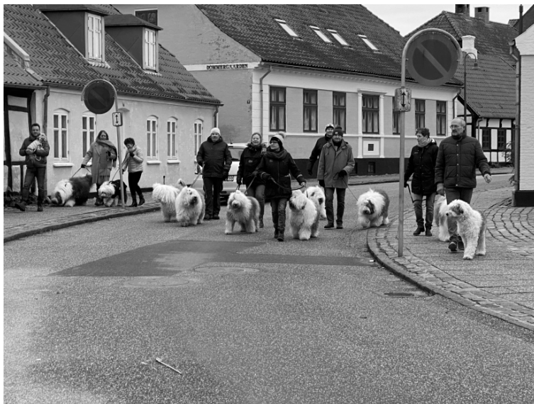
10•10 fylder godt op i Sæbys smukke Algade