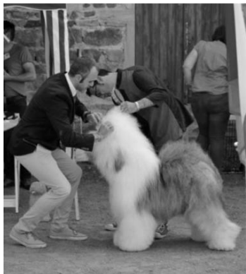
CH. AIR ZEPPELINE AMADEUS ved EURO

Pelsen har en strid struktur, lang og ikke lige, hverken krøllet eller glat, med en tyk og overdådig underpels, som er vandafvisende, over hele kroppen. Hoved, nakken og fronten er godt beklædt med hår, men bagparten er endnu mere fyldig. Pelsen struktur og kvalitet har større betydning end mængden og længden.