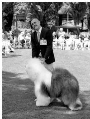
Multi BIS BISS UK. I.CH. WINSYLOT

Hovedet skal aldrig ligne en Bichon, men det skal være naturligt. Man kan studse ørerne hvis de er for lange og uden for hovedets størrelse, ved at gøre dem lidt kortere med en filer saks. Skulle hovedets pels være for lang, kan man gøre den kortere ved at bruge plucking metoden. Man kan bruge trøflen som reference: Skallens hår skal ikke være længere end afstanden til trøflen, som skal være stor og synlig.